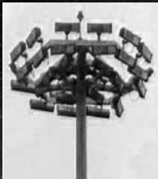
I riflettori simmetrici di questa torre faro inviano buona parte della luce verso il cielo, quasi il 50%.

che hanno intenzione o necessità di utilizzare impianti di luce esterna (anche in forma pubblicitaria nel caso delle insegne).