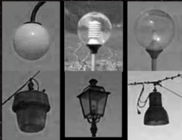
Esempi di ottiche altamente inquinanti, anche se alcune di esse potrebbero sembrare schermate.

Tutto ciò in spregio alle più elementari norme di buon senso, con enormi