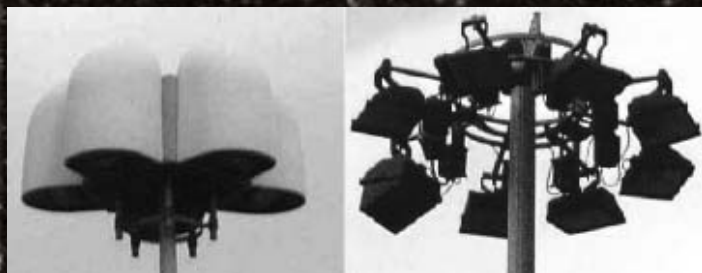
L'utilizzo di fari asimmetrici permette di costruire torri faro totalmente schermate anche di notevoli dimensioni. Nella foto di destra si ha avuto l'accortezza di limitare (la dove non serviva) il flusso luminoso con degli schermi applicati sul riflettore