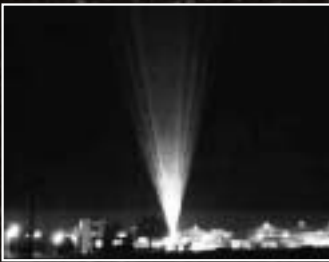
Fasci di luce: vietato l'uso su tutto il territorio di quelli fissi o rotanti (puntati verso l'alto) per fini pubblicitari o di richiamo (ad esempio quelli delle discoteche) e di altro tipo che possa essere fonte di abbagliamento o disturbo.

di Malpensa - Milano o aree densamente illuminate, in un parco USA illuminato a giorno, alcuni orsi hanno distrutto i vari lampioni in quanto "fastidiosi". Numerose specie notturne sono messe in pericolo di estinzione dall'avanzare dell'illuminazione di Barcellona..