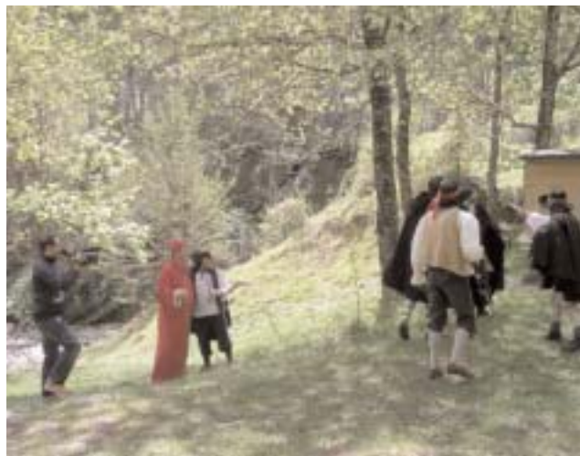
Una scena della manifestazione