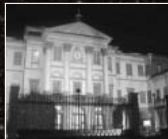
I monumenti devono essere illuminati dall'alto verso il basso. Nel caso in cui ciò non risulti possibile e per soggetti di particolare e comprovato valore architettonico, i fasci di luce devono rimanere di almeno un metro al di sotto del bordo superiore della superficie da illuminare. Nella foto le condizioni non sono rispettate

▫ ecologico - l'illuminazione notturna ha sicuramente un effetto negativo sull'ecosistema circostante, flora e fauna vedono modificati il loro ciclo naturale "notte - giorno". Il ciclo della fotosintesi clorofilliana che le piante svolgono nel corso della notte subisce alterazioni dovute proprio ad intense fonti luminose che, in qualche modo, "ingannano" il normale oscuramento. Ecco alcuni semplici esempi scelti nei centinaia presenti in letteratura: le migrazioni degli uccelli vengono fortemente influenzate e messe in pericolo da situazioni quali quelle dell'Aeroporto